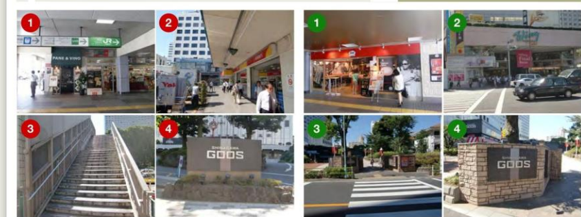
経路1 歩道橋を渡る経路 (ホテル正面に出ます)