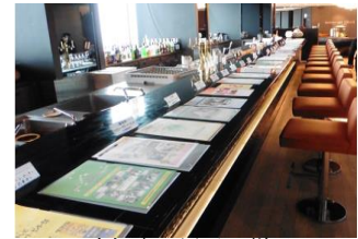
昨年度の展示の様子